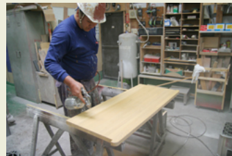
4 下塗り状況 (2工程)