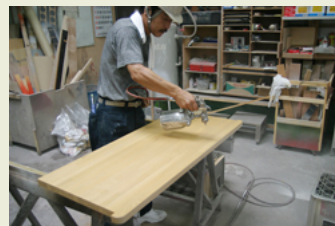
6 上塗り状況 (2工程)