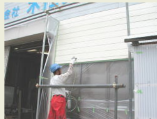
5 下塗り・サビ止め状況