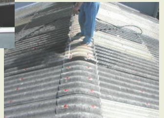
3 水洗い(高圧洗浄)状況